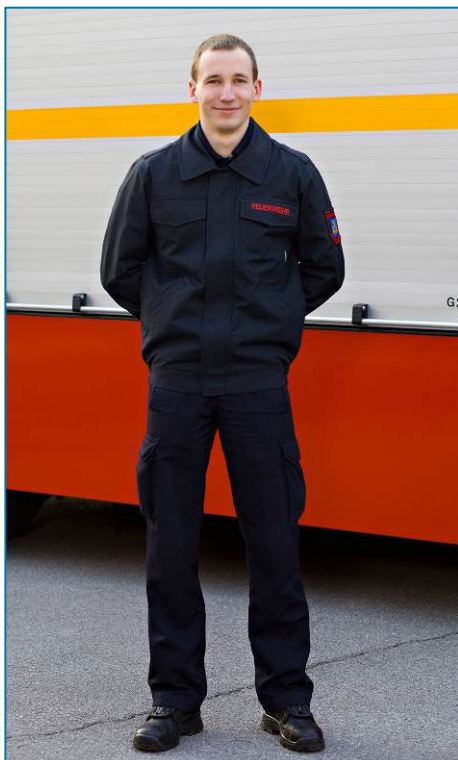
Theoretische Aus- und Fortbildung