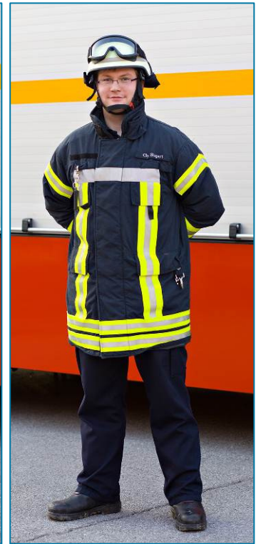
Technische Hilfe / Übungsdienst