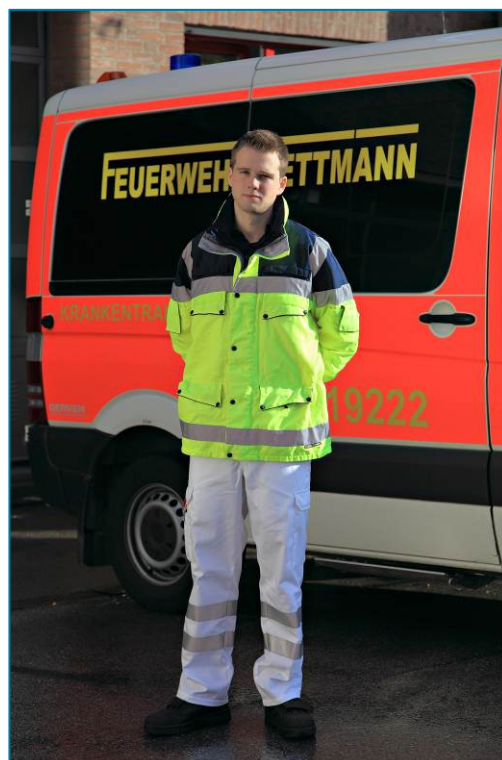
Rettungsdienst / Krankentransport