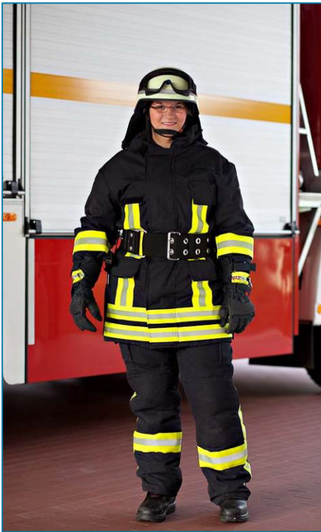
Brandschutz / Übungsdienst